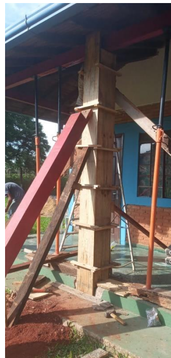
Nå er det betong.