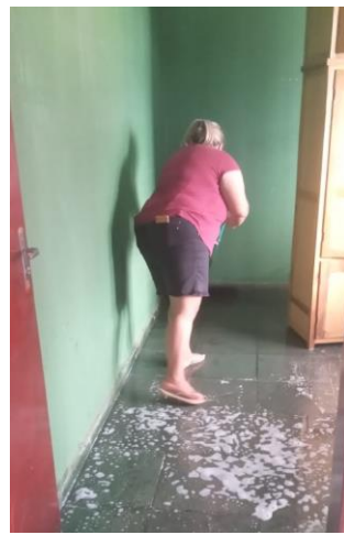
Mirian i virksomhet