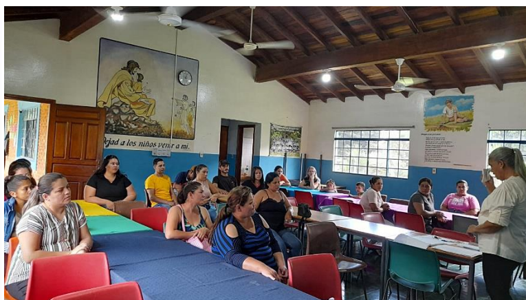
Bilde fra første foreldremøtet for daghjemmet og skolen.

Vi startet med forberedende aktiviteter 5. februar. Den 21. februar kom barna etter sommerferien. Denne gang begynte vi med 70 barn fra 2 til 8 år. Det er faktisk 12 barn flere enn vi har hatt tidligere.