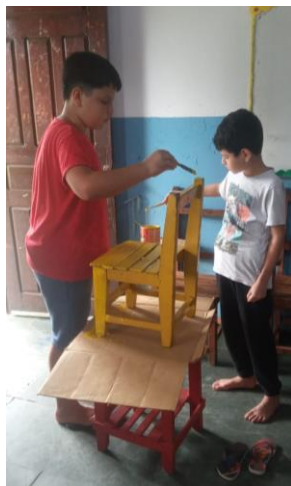
Barn i aktivitet.