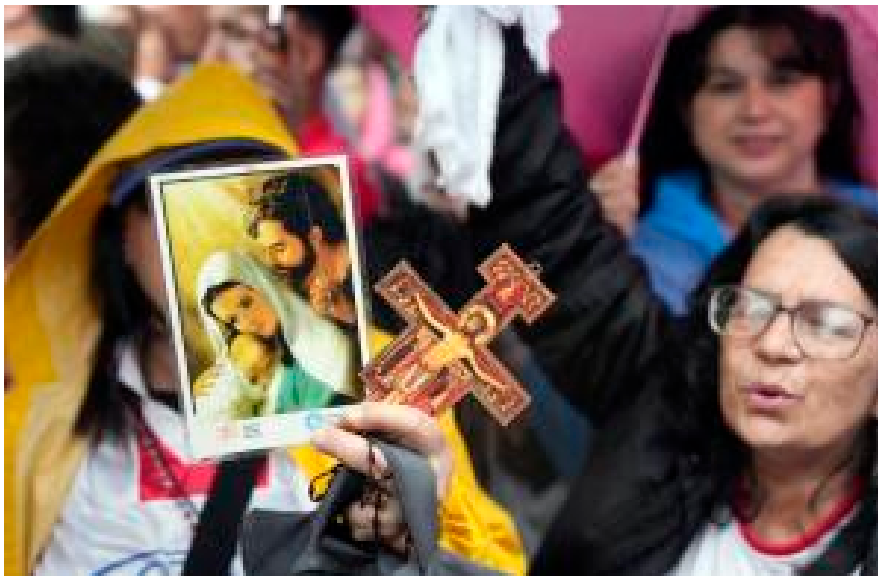
Katolske abortmotstandere i Paraguay protesterer mot at det nå skal innføres seksualundervisning i landets skoler.

I 2017 ble Paraguay det første landet som forbød diskusjoner om kjønnsidentitet i skolen.