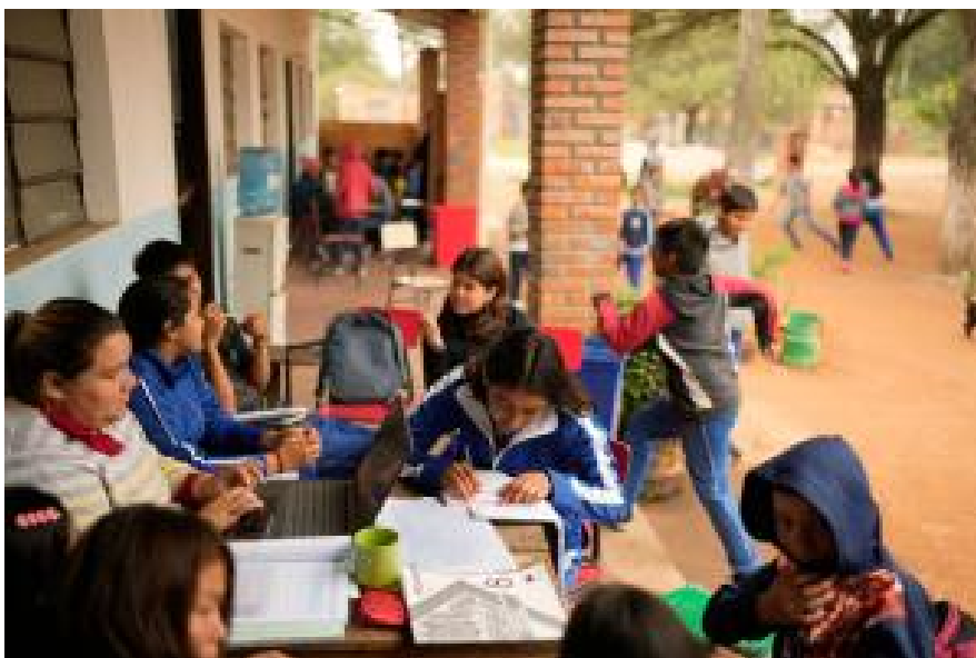
8.-klassinger får undervisning ved Nueva Asuncion skole i Chaco-i, Paraguay.

Pensum fremmer derfor avholdenhet og omtaler sex som Guds oppfinnelse til ektepar.