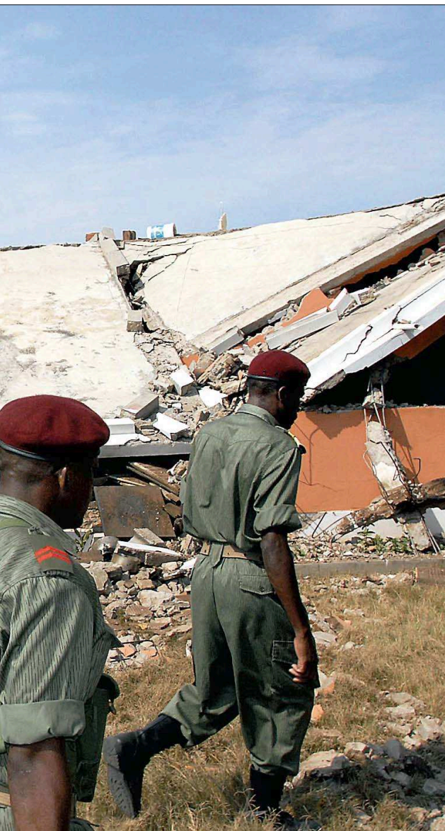
Bæder i Maputo torsdag.